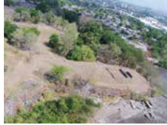
Figura 2. Vista del estado actual de las Casas Reales. 2014.