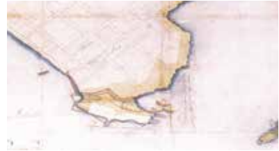
Figura 7. Ampliación del mapa de Panamá en 'Descripciones geográficas e hidrográficas de muchas tierras y mares del Norte y Sur en las Indias...' de 1632.

de la ciudad, entre 1586 y 1609 aproximadamente (Figura 8f).