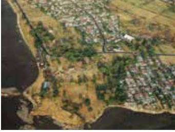
Figura 1. Vista del sitio arqueológico con la localización de las Casas Reales. Foto aérea: Félix Durán Ardila, 2004.