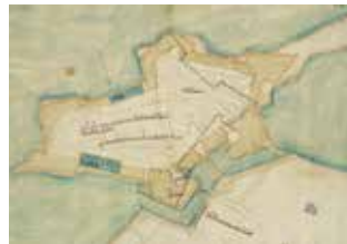
Figura 4. 'Planta de la fortificación para las Casas Reales de Panamá' de 1586 atribuida a Bautista Antonelli.