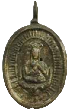
Medalla religiosa. Siglo XVI. Cobre. Colección Patronato Panamá Viejo