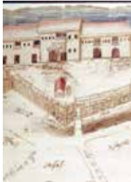
Figura 6. Ampliación de la 'Discreción (plano) de la Ciudad de Panamá y el sitio donde están las Casas Reales y la Ysla de Perico y las demás Yslas' atribuida a Cristóbal de Roda en 1609.