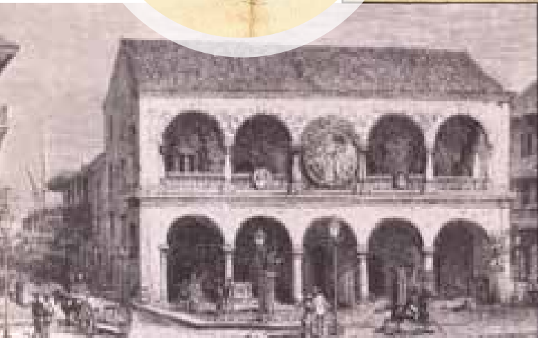
Edificio del cabildo en la Plaza Mayor. Grabado de Armand Reclus, 1870.

En la Plaza Mayor se congregaron los vecinos de San Felipe y Santa Ana, «queriendo ser testigos del acto más grandioso de la historia de la vida social del país»